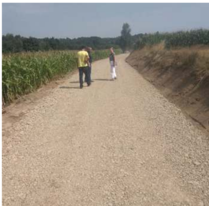
Trzciana - Wołowiec