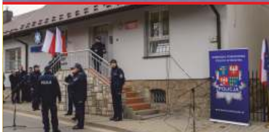
Przywrócenie Posterunku Policji