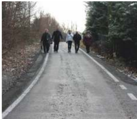
Kamionna - Polityczna