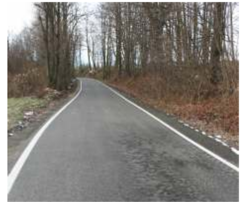
Ujazd - Zyznowka