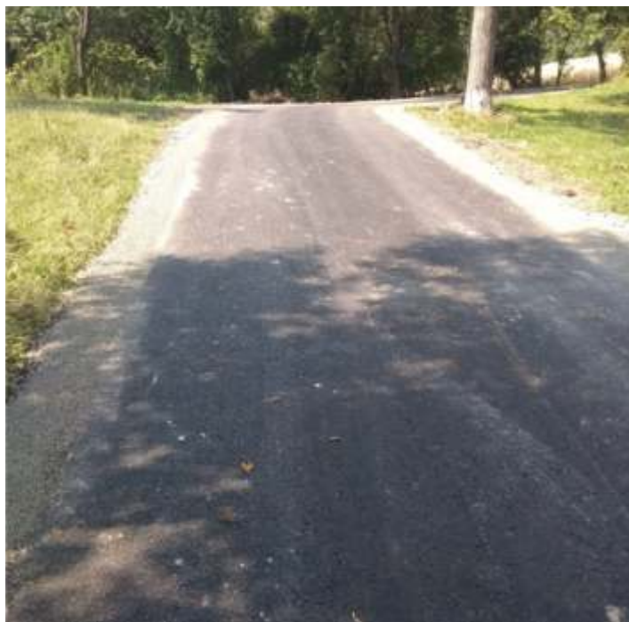
Rdzawa - Góry