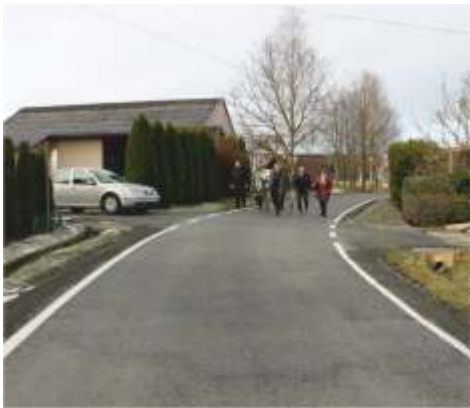
Łka Dolna - Półrolki

Remonty dróg wykonała firma PPUH "TRANS-BET" z Gnojnika. Remont drogi gminnej Łka Dolna-Półrolki obejmuje 300mb drogi, Kamionna- Polityczna - 210mb, a Ujazd-Zyznowka - 200mb. Prace na każdej z dróg polegały na wyprofilowaniu uszkodzonej nawierzchni, utwardzeniu jej kruszywem tłuczniowym, ułożeniu masy asfaltowej i umocnieniu poboczy kruszywem naturalnym.