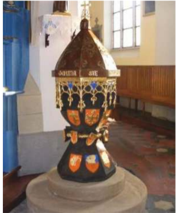
Trzcia ska chrzcielnica przed i po renowacji