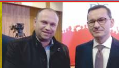
Podziękowanie Wójta dla Premiera