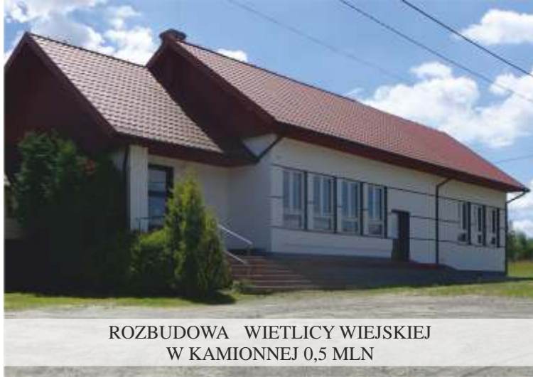
ROZBUDOWA WIETLICY WIEJSKIEJ W KAMIONNEJ 0,5 MLN

Rozbudowujemy i wyposażamy istniejące budynki użyteczności publicznej oraz wspieramy finansowo Ochotnicze Straże Pożarne. Gotowość bojowa i wyszkolenie naszych Druhów jest na bardzo wysokim poziomie. Przez cztery lata wspieraliśmy ich pomysły i inicjatywy, czego wynikiem są m.in.: cztery nowe wozy strażackie.