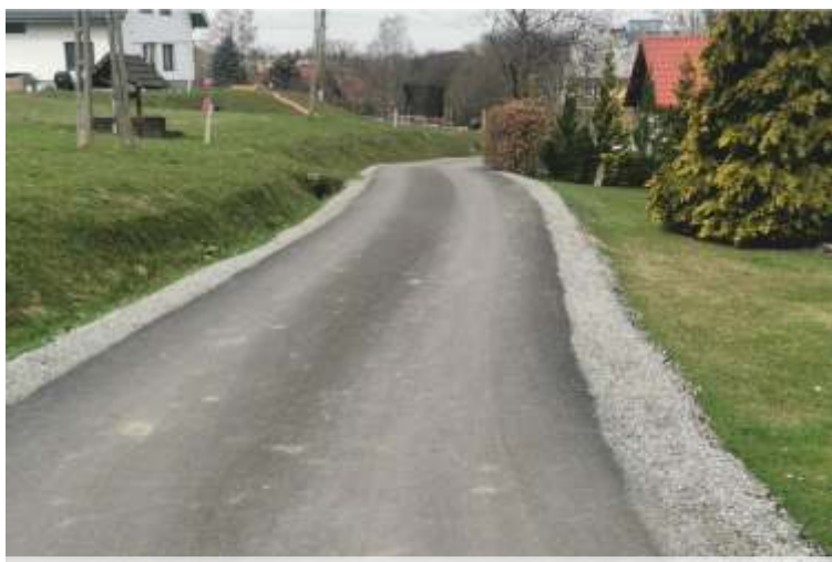
KAMIONNA - NAD KRÓLEM