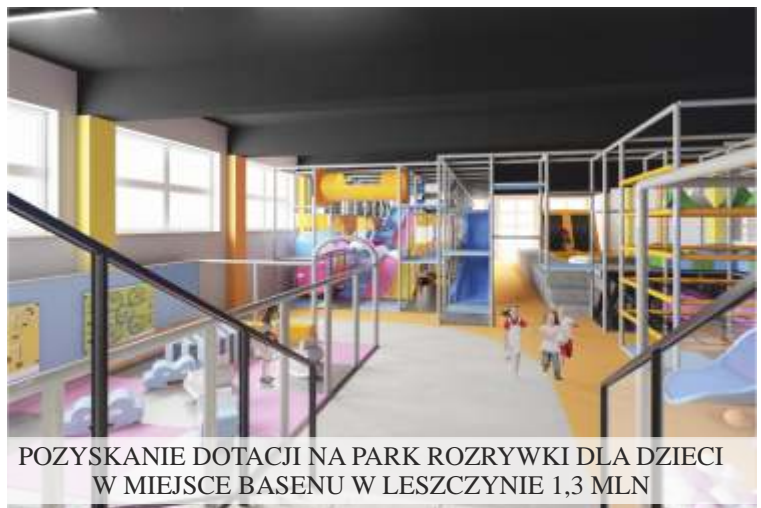
POZYSKANIE DOTACJI NA PARK ROZRYWKI DLA DZIECI W MIEJSCIE BASENU W LESZCZYNIU 1,3 MLN