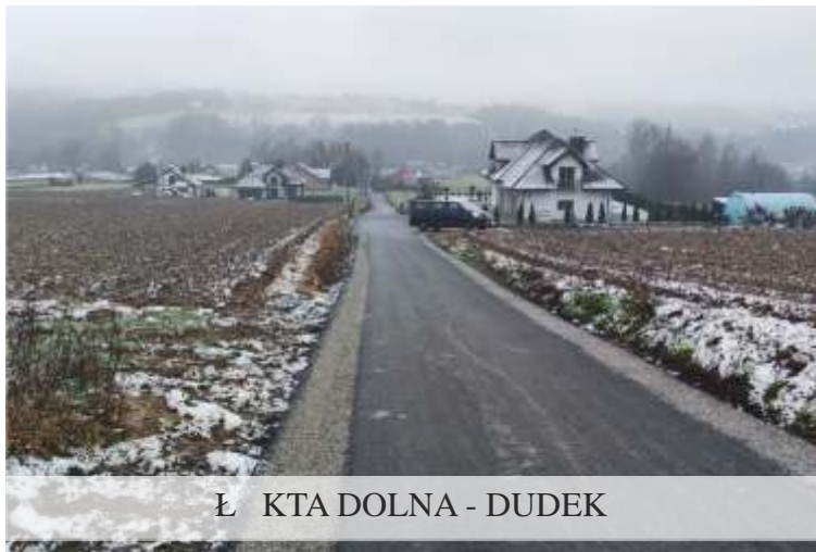
Ł KTA DOLNA - DUDEK