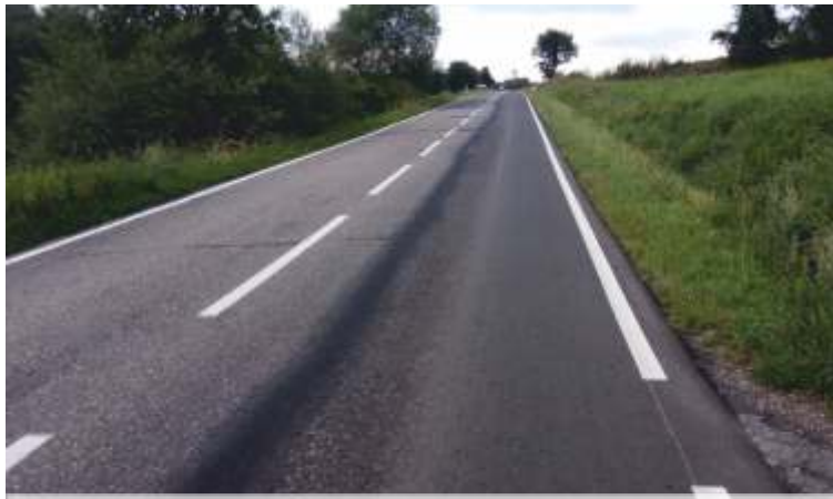
MODERNIZACJA DROGI WOJEWÓDZKIEJ TRZCIANA - DZIAŁY 4,2 MLN - BUD ET WOJEWÓDZTWA