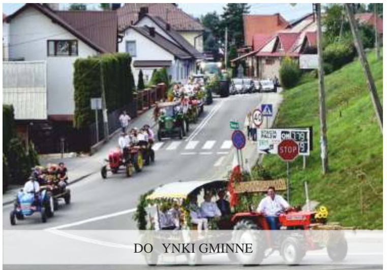
DO WYNIKI GMINNE

Dokonując podsumowania należy przyznać, że ostatnie lata były czasem długich dyskusji, trudnych decyzji i walki o finansowe środki zewnętrzne. Jednocześnie nie był to czas, w którym zrealizowali my wiele zadań inwestycyjnych i rozwiali my wiele problemów, realizując swoją misję w sposób zrównoważony i skuteczny.