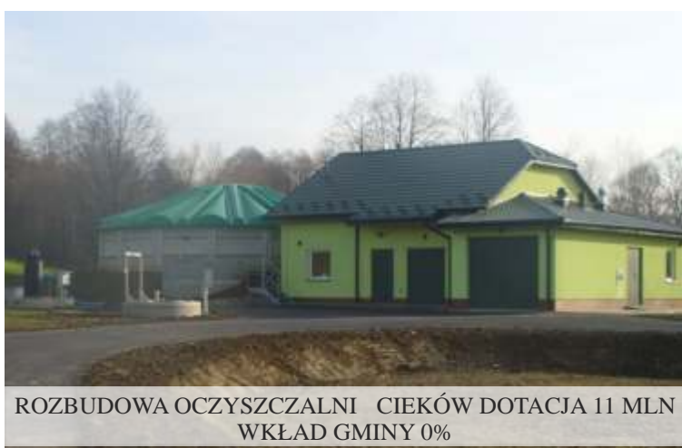
ROZBUDOWA OCZYSZCZALNI CIEKÓW DOTACJA 11 MLN WKŁAD GMINY 0%