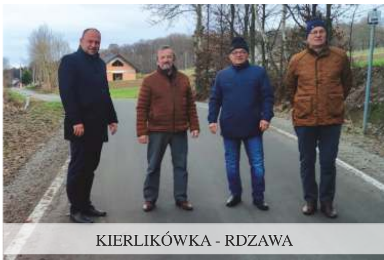
KIERLIKÓWKA - RDZAWA