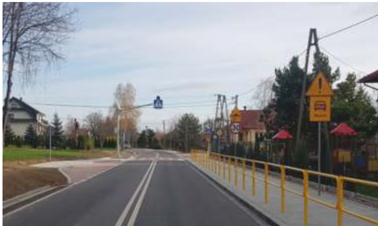
MODERNIZACJA DROGI POWIATOWEJ PRZEZ KIERLIKÓWK 5 MLN - WKŁAD GMINY 940 TY .