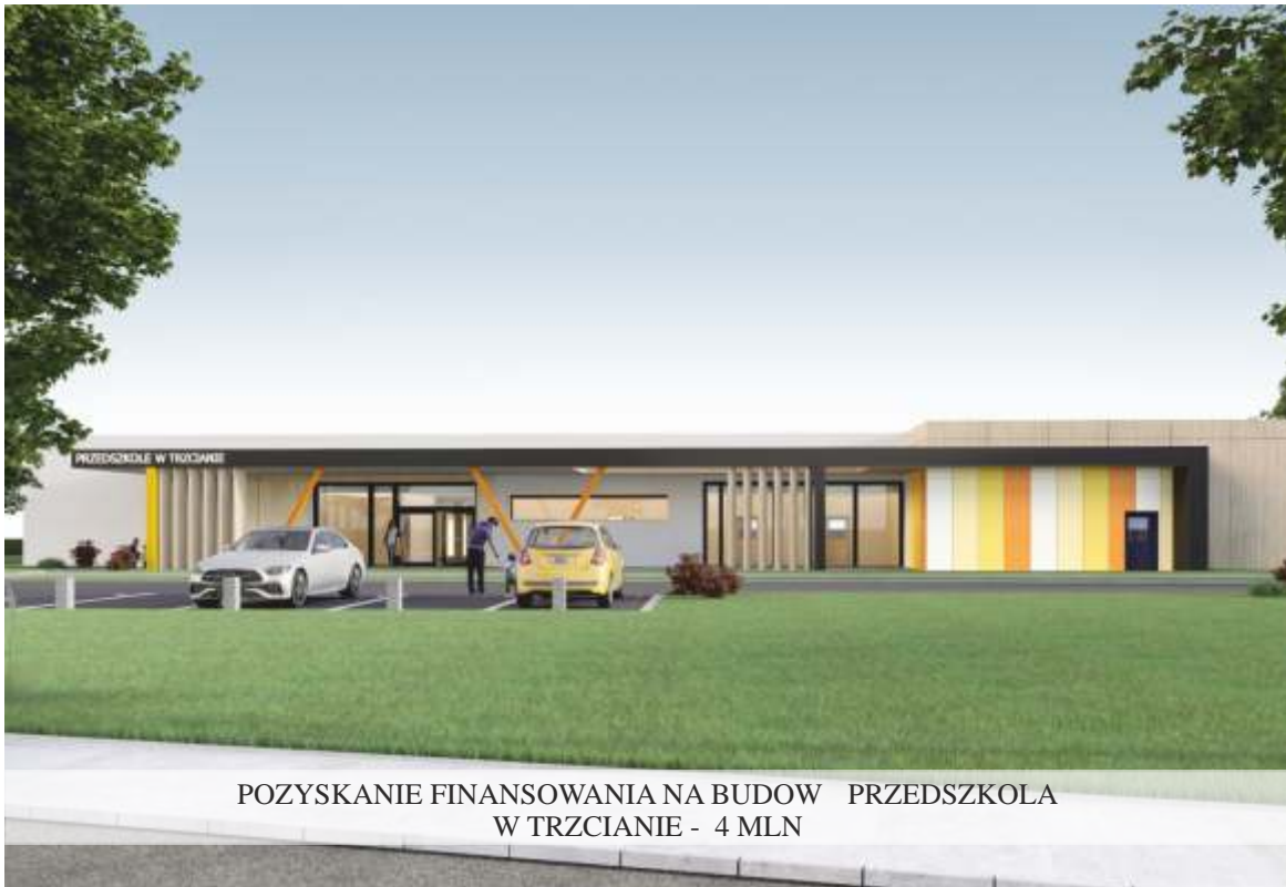
POZYSKANIE FINANSOWANIA NA BUDOWĘ PRZEDSZKOLA W TRZCIANIE - 4 MLN

Nie zapomnieliśmy o najmłodszych - powiększyliśmy bazę miejsc w gminnych placówkach o wiatowych oraz dotujemy niepubliczne przedszkola. Finansujemy obiekty sportowe i poszerzamy ich infrastrukturę.