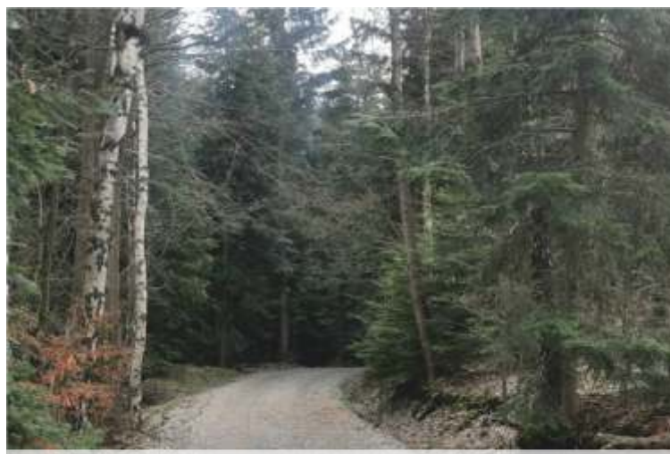
KAMIONNA - PACEK