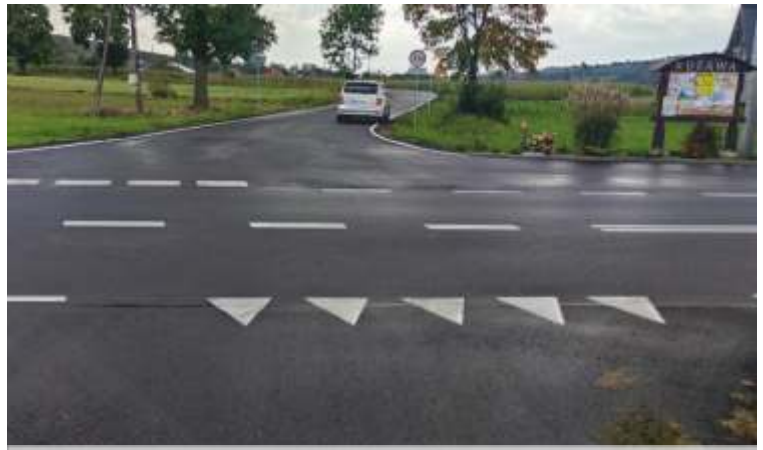
MODERNIZACJA DRÓG GMINNYCH W RDZAWIE PRZEZ CENTRUM, RDZAWA GÓRY - DO KO CIOŁA