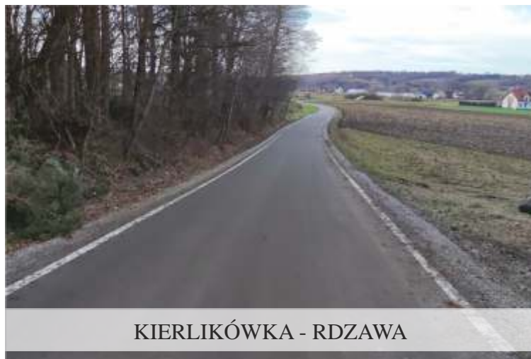
KIERLIKÓWKA - RDZAWA