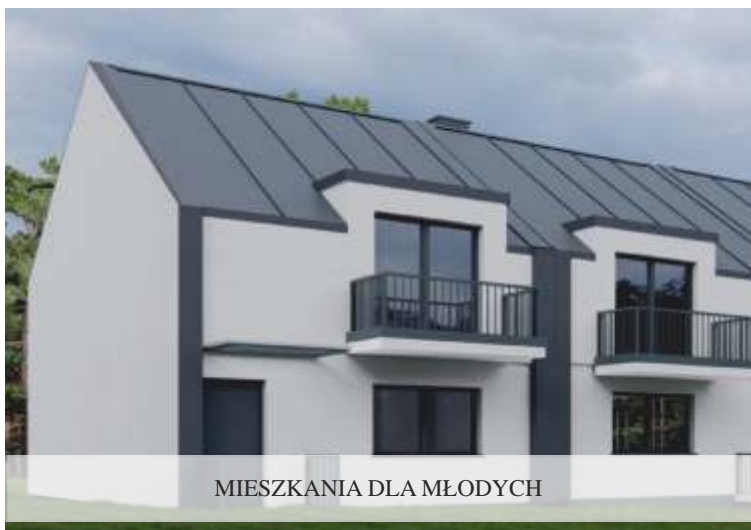
MIESZKANIA DLA MŁODYCH