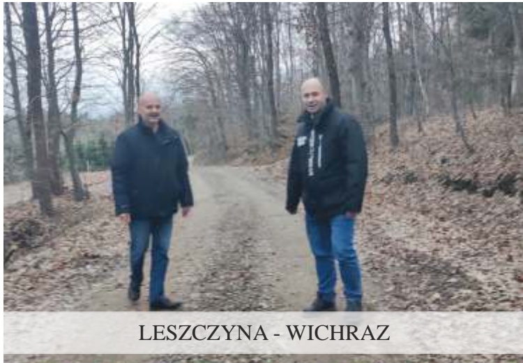
LESZCZYNA - WICHRAZ