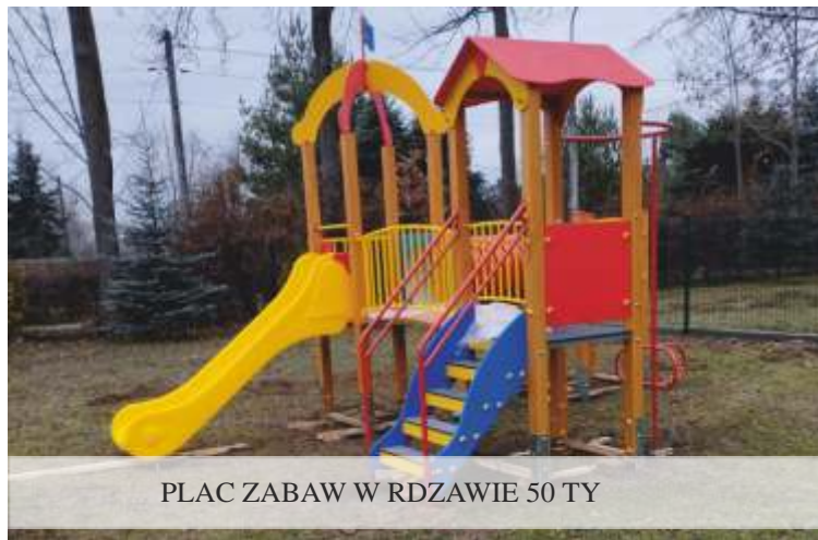
PLAC ZABAW W RDZAWIE 50 TY