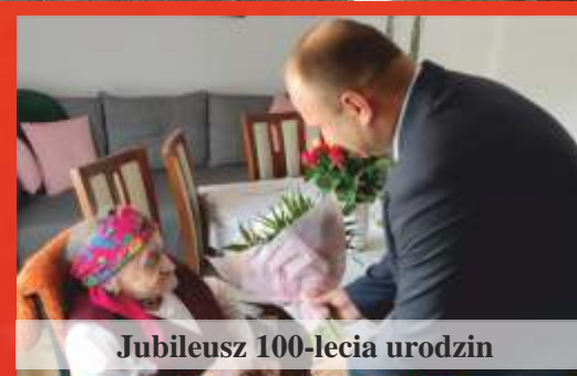
Jubileusz 100-lecia urodzin