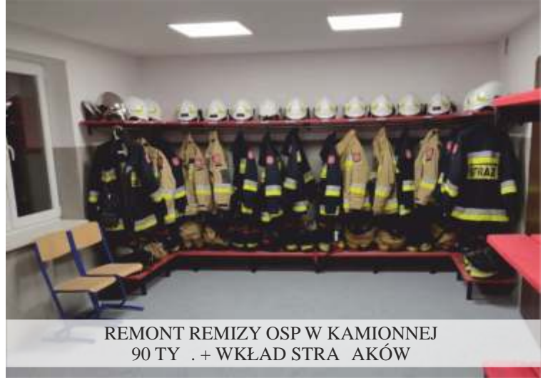
REMONT REMIZY OSP W KAMIONNEJ 90 TYŚ. + WKŁAD STRAŻAKÓW