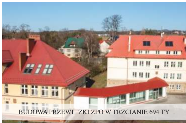
BUDOWA PRZEWI ZKI ZPO W TRZCIANIE 694 TY .