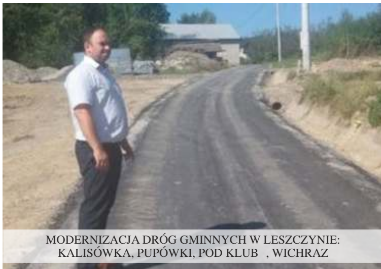
MODERNIZACJA DRÓG GMINNYCH W LESZCZYŃCIE: KALISÓWKA, PUPÓWKI, POD KLUB , WICHRAZ