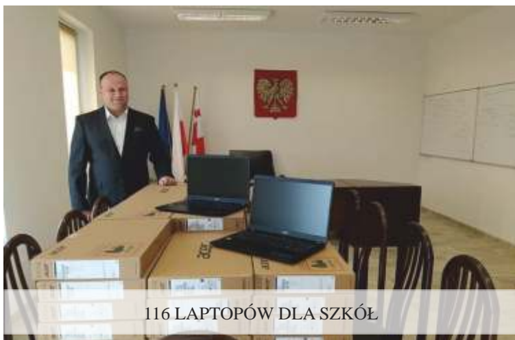
116 LAPTOPÓW DLA SZKÓŁ