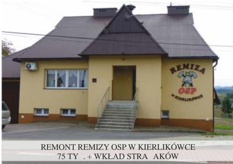
REMONT REMIZY OSP W KIERLIKÓWCE 75 TYŚ. + WKŁAD STRAŻAKÓW