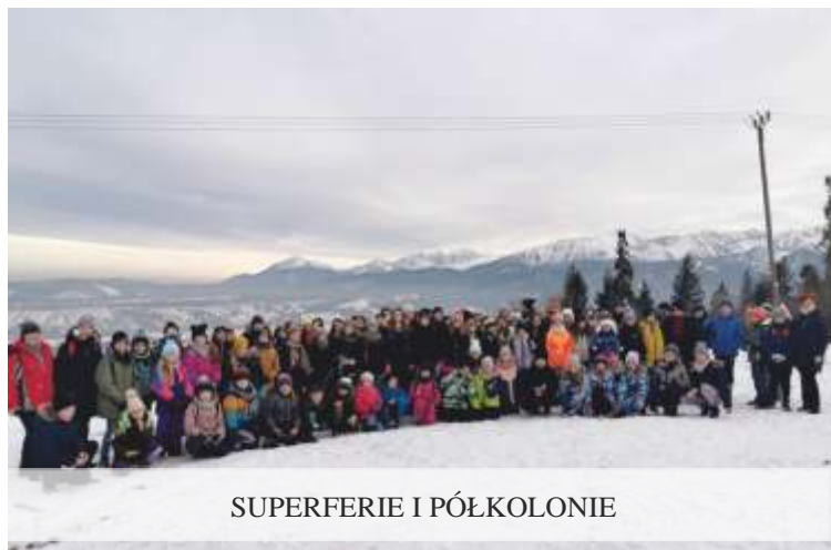
SUPERFERIE I PÓŁKOLONIE