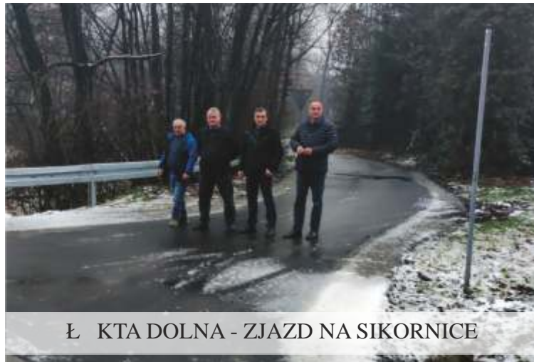
Ł KTA DOLNA - ZJAZD NA SIKORNICE