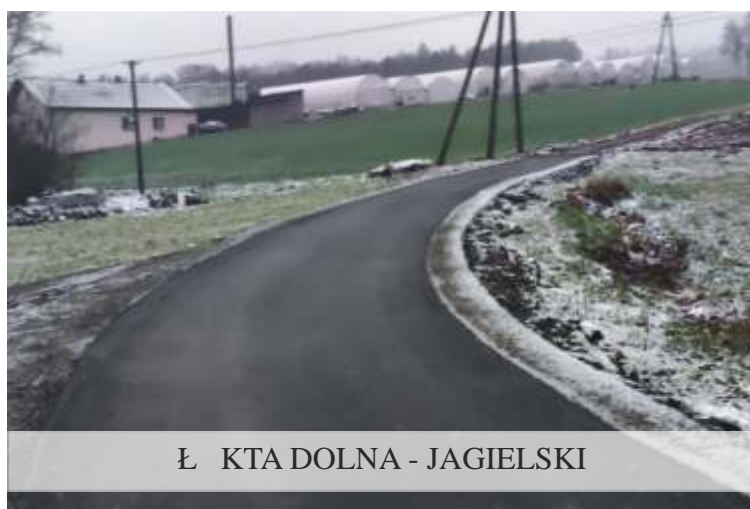
Ł KTA DOLNA - JAGIELSKI