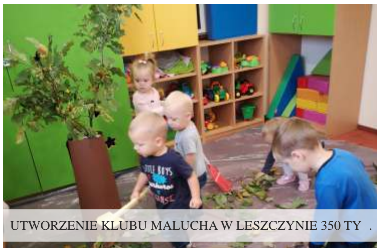
UTWORZENIE KLUBU MALUCHA W LESZCZYNIE 350 TY .