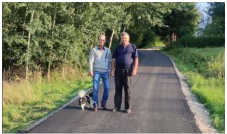
MODERNIZACJA DRÓG GMINNYCH W UJE DZIE: W KIERUNKU ZYŻNÓWKI, BIROS, LE NIAK, MARZEC, WALIGÓRA