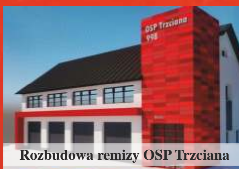
Rozbudowa remizy OSP Trzciana