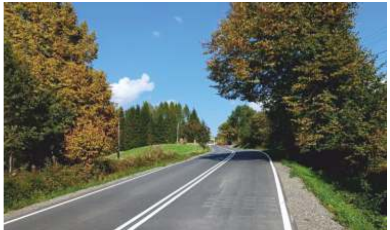
MODERNIZACJA DROGI POWIATOWEJ UJAZD - KAMIONNA 1,7 MLN - BUD ET POWIATU