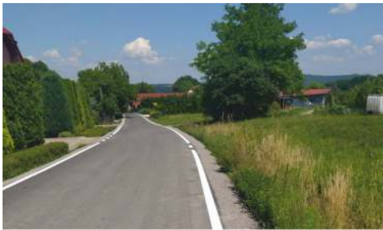
MODERNIZACJA DRÓG GMINNYCH W Ł KCIE DOLNEJ: PÓŁROLKI - BABRAL, P CZEK, ZADZIELE, JAGIELSKI, DUDEK