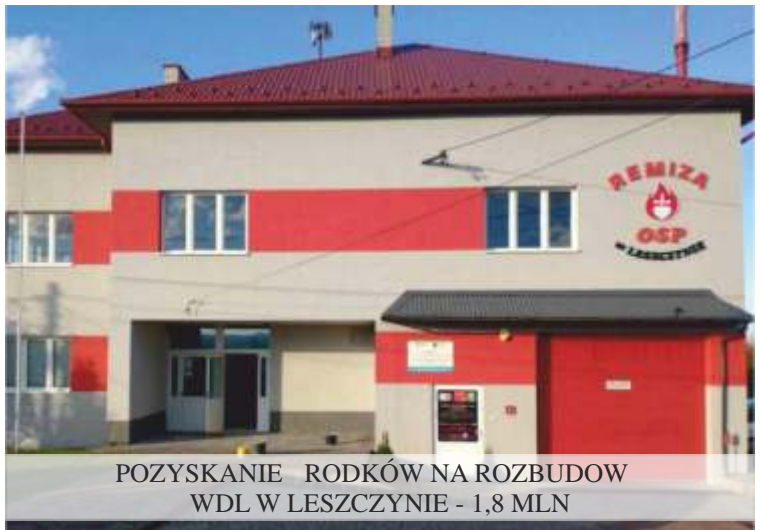
POZYSKANIE RODKÓW NA ROZBUDOWĘ WDL W LESZCZYNIE - 1,8 MLN