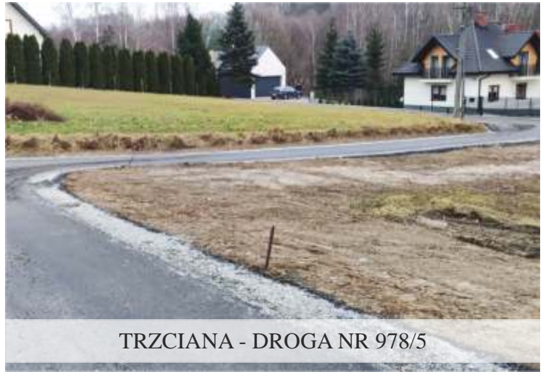
TRZCIANA - DROGA NR 978/5