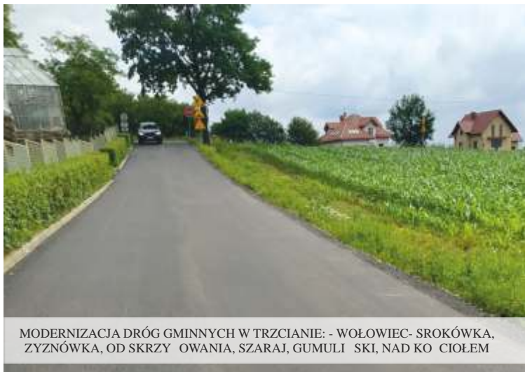
MODERNIZACJA DRÓG GMINNYCH W TRZCIANIE: - WOŁOWIEC- SROKÓWKA, ZYŻNÓWKA, OD SKRZYŻOWANIA, SZARAJ, GUMULSKI, NAD KOCIEM