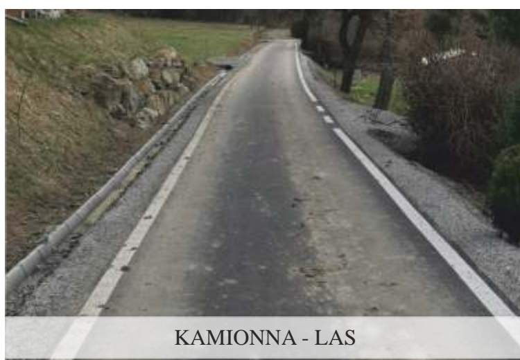
KAMIONNA - LAS