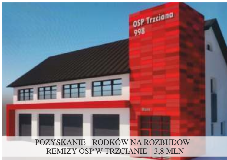
POZYSKANIE RODKÓW NA ROZBUDOWĘ REMIZY OSP W TRZCIANIE - 3,8 MLN