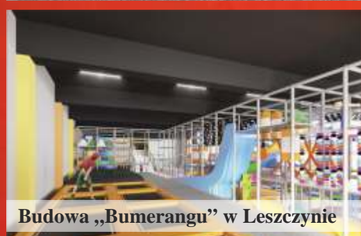
Budowa „Bumerangu” w Leszczynie