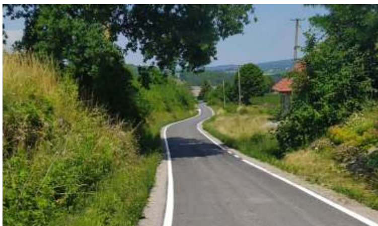
MODERNIZACJA DRÓG GMINNYCH W KAMIONNEJ: - POLITYCZNA, BRZEG, NAD KRÓLEM, DO LASU, PACEK