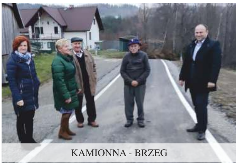
KAMIONNA - BRZEG