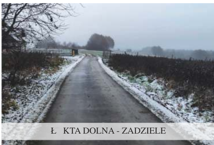
Ł KTA DOLNA - ZADZIELE