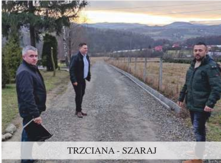
TRZCIANA - SZARAJ