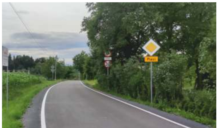
MODERNIZACJA DRÓG GMINNYCH W KIERLIKÓWCE: W KIERUNKU KO CIOŁA, DO STOKŁOSY, DO RDZAWY