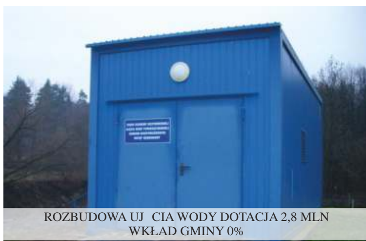
ROZBUDOWA UJ CIA WODY DOTACJA 2,8 MLN WKŁAD GMINY 0%

W gminnym zestawieniu finansowym znacz ce miejsce odgrywaj inwestycje. Efekty wida na wyremontowanych drogach, dokonali my rozbudowy oczyszczalni oraz uj cia wody. Dzi ki wspólnym staraniom z samorz dem powiatu wyremontowali my trzy odcinki dróg powiatowych.