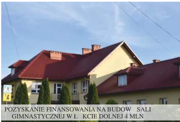
POZYSKANIE FINANSOWANIA NA BUDOWĘ SALI GIMNASTYCZNEJ W ŁĘKOCIE DOLNEJ 4 MLN