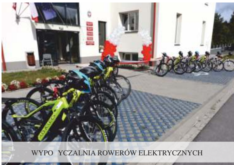
WYPYCZALNIA ROWERÓW ELEKTRYCZNYCH