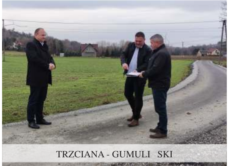
TRZCIANA - GUMULI SKI