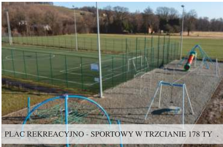
PLAC REKREACYJNO - SPORTOWY W TRZCIANIE 178 TY .