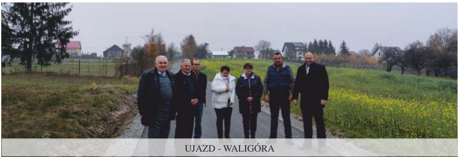
UJAZD - WALIGÓRA