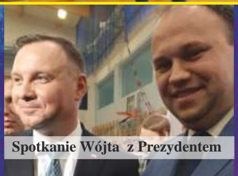
Spotkanie Wójta z Prezydentem