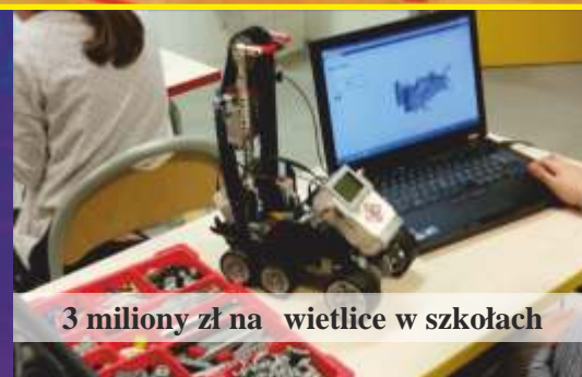
3 miliony zł na wietlice w szkołach