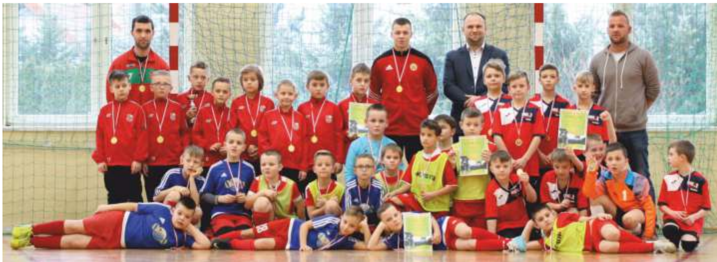
Turniej o Puchar Przewodnicz cej Rady Gminy