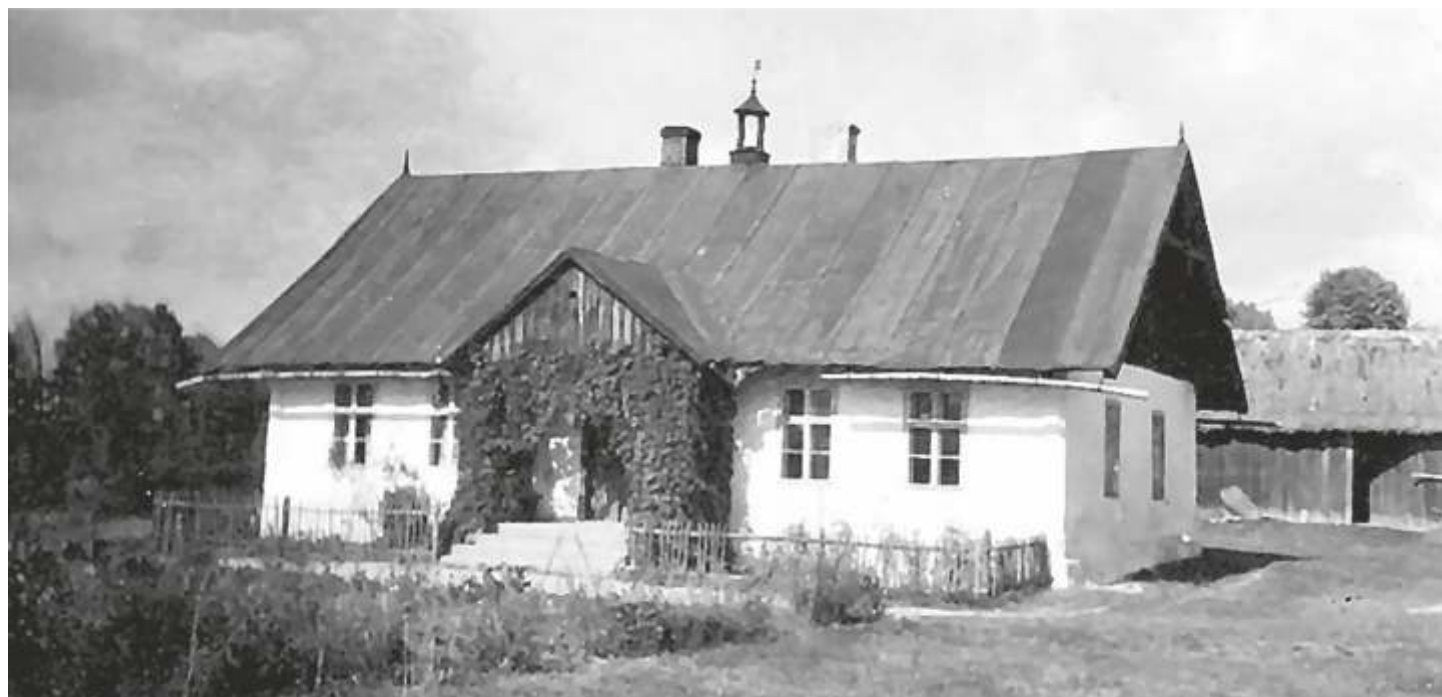
Stara szkoła w Trzcianie. Dziś budynek już nie istnieje. Zdjęcie z początku XX wieku.

Zgodnie z zaleceniem zarządu z 1872 roku pojawiła się możliwość uzyskania od Krajowego Funduszu Szkolnego bezzwrotnego zasiłku lub pożyczki bezprocentowej na budowę szkół. Zachowało się pismo Rady Okręgowej w Bochni, które informuje, że 4 grudnia 1885 r. trzy Ministerstwa: Rolnictwa, Skarbu, Wyznań i Oświaty zezwoliły na zakup parceli pod budowę szkoły w Trzcianie. Pismo zobowiązuje tutaj Radę Szkolną do bezzwłocznego