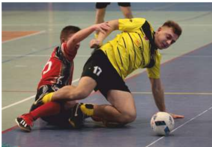
Turniej seniorów o Puchar Prezesa Sparty Kazimierzy Wielka