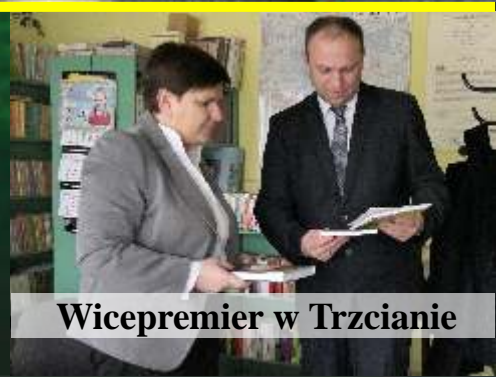
Wicepremier w Trzcianie