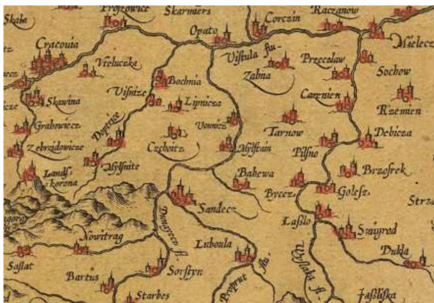
Fragment mapy „Południowa Polska - l sk, Małopolska, wi tokrzyskie, Mazowsze XVII w. (Polonie et Silesia)”.

Kanonicy z Trzciany zakupili przed rokiem 1529, znajduj c si na terenie swojej parafii, wie Bedlna (dzi Beldno). Spisana w roku 1529 „Liber retaxatorium” (Ksi ga dochodów) informuje o tym, e klasztor w Trzcianie pobierał z Trzciany: od karczmy 4 grzywny, z młyna 1 kop groszy, od kmieci 1 i pół grzywny i 6 groszy. Glinik uiszczal: z karczmy 1 kop , kmiecie 2 grzywny i 15 groszy. Zyznówka opłacała od 8 kmieci po 9 groszy, czyli 1 1/2 grzywny. Z Libichowej klasztor przyjmował opłat w wysoko ci: 1 kopy od młyna, 11/2 grzywny od karczmy i 4 grzywny od 4 zagrodników. Z Beldnej 8 kmieci płaciło 2 grzywny i 20 groszy. Z Sieradzki od kmiecia, czyli z karczmy 1 kop i 8 groszy. Z Uj cia 1 kmie płacił 1 grzywn i z połowy młyna opłacano 1 grzywn . Z Cichawki 1 zagrodnik oddawał 30 groszy. Nadto ze wszystkich wsi nale cych do parafii w Trzcianie nale ało si Kanonikom de Poenitentia meszne (nazwa podatku przysługuj cego parafii za odprawianie mszy w ko cie) w wysoko ci 6 1/2 grzywny i 12 groszy. Zsumowane dochody klasztoru z powy szego okresu wynosiły 44 grzywny i 35 groszy. Powy sze dane daj nam wyobra enie o strukturze społecznej i gospodarce tego terenu.