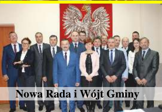
Nowa Rada i Wójt Gminy