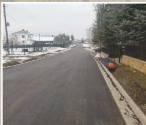
Stabilizacja osuwiska w Kierlikówce