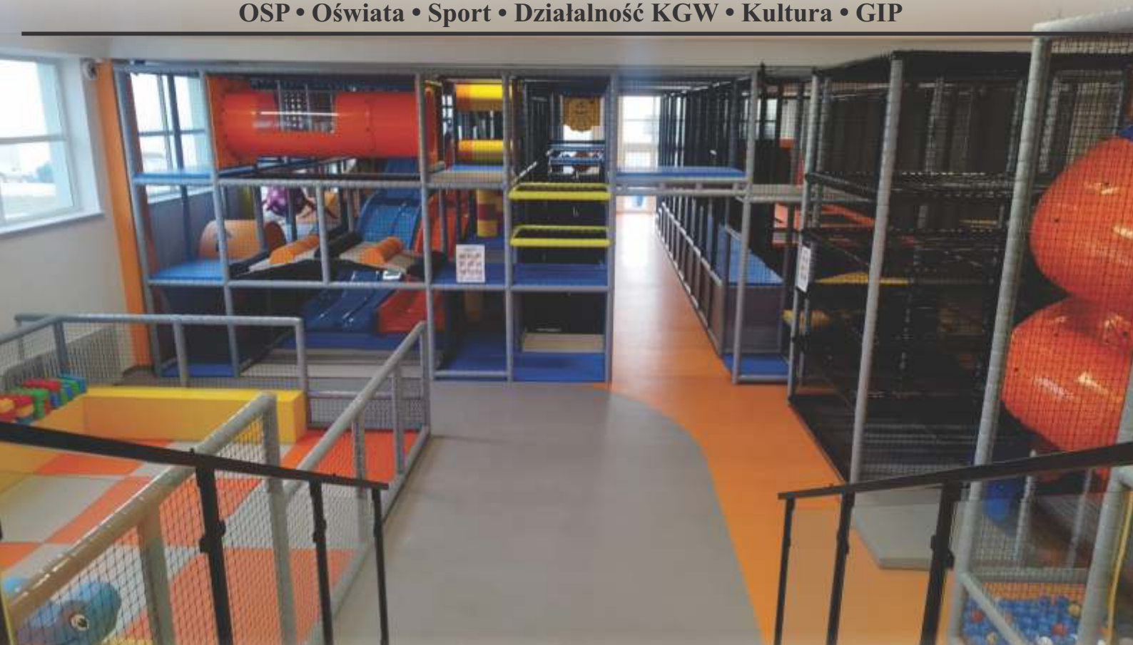
Wewnętrzny plac zabaw „Bumerang” w Leszczynie

Investycje • Dotacje • Wydarzenia OSP • Oświata • Sport • Działalność KGW • Kultura • GIP