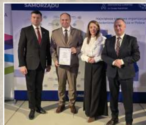
I miejsce w powiecie w Rankingu Gmin