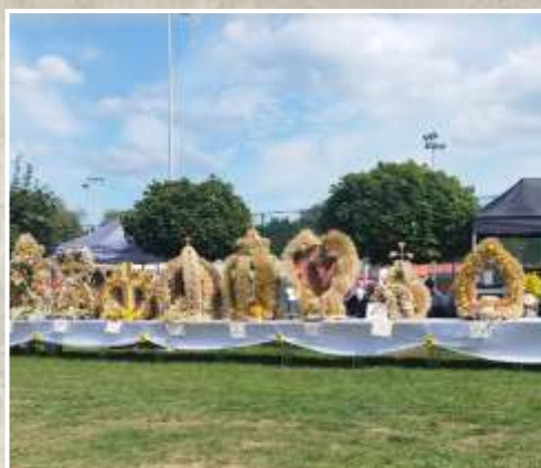
Dożynki powiatowe w Trzcianie